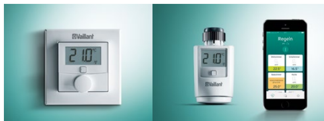
Termostat pomieszczeniowy VR 51