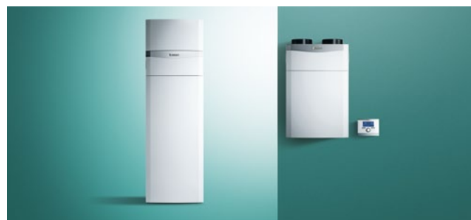
Systemowe rozwiązanie: kocioł kondensacyjny ecoTEC VC, rekuperacja recoVAIR VAR 260, regulator systemowy mutliMATIC VRC 700

Vaillant w swoim portfolio oferuje systemowe urządzenia grzewcze, wentylacyjne oraz regulatory dla budynków jednorodzinnych. Posiada zaplecze autoryzowanych Instalatorów Systemowych, którzy zapewniają kompleksową realizację instalacji. Systemowa oferta rozwiązań Vaillant pozwala zaoszczędzić pieniądze i czas oraz gwarantuje jakość wykonania instalacji oraz kompetentny serwis gwarancyjny i pogwarancyjny.